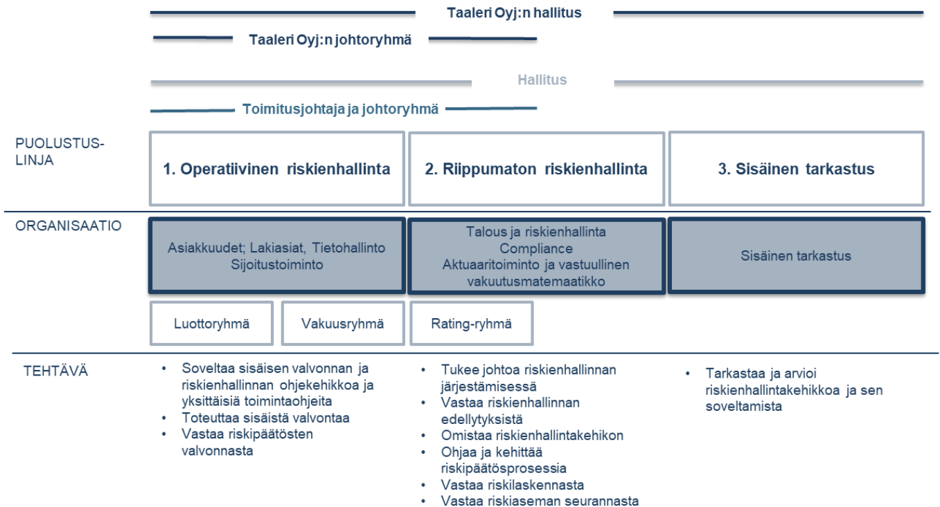
Kuva 4: Garantian sisäisen valvonnan ja riskienhallinnan puolustuslinjat

Yhtiön keskeiset toiminnot ovat Säännösten noudattamista valvova toiminto (compliance), Talous ja riskienhallinta - yksikön Riskienhallintatoiminto, Sisäinen tarkastus sekä Aktuaaritoiminto ja vastuullinen vakuutusmatemaatikko. Sisäisen tarkastuksen tehtävien järjestämisestä vastaava henkilö on yhtiön päälakimies, Aktuaaritoiminnon ja vastuullisen vakuutusmatemaatikon tehtävien järjestämisestä sekä Riskienhallintatoiminnosta vastaava henkilö on Talous- ja riskienhallintajohtaja. Säännösten noudattamista valvovan toiminnon järjestämisestä vastaava henkilö on yhtiön lakimies. Kukin keskeinen toiminto raportoi yhtiön hallitukselle sisäisen valvonnan ja riskienhallinnan toimintaperiaatteissa kuvatulla tavalla.