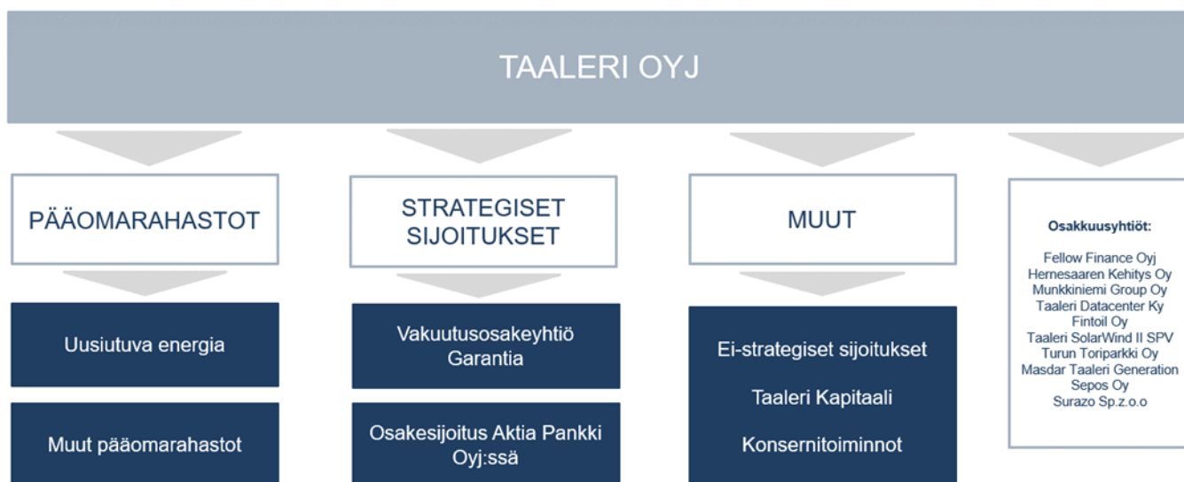
Kuva 1: Taaleri-konsernin rakenne 31.12.2021

Taaleri Oyj tytäri- ja osakkuusyhtiöineen muodosti rahoitus- ja vakuutusryhmittymien valvonnasta annetussa laissa (RavaL) määritellyn vakuutuspainotteisen rahoitus- ja vakuutusryhmittymän 29.10.2021 asti. Ryhmittymän emoyhteisönä toimi Taaleri Oyj. Taaleri Oyj ja Garantia ovat rahoitus- ja vakuutusryhmittymän purkautumisen jälkeen saaneet Finanssivalvonnalta alustavan kannanoton siitä, että Finanssivalvonta katsoo Taaleri-konsernin muodostavan vakuutusyhtiölain 26 luvun mukaisen vakuutusryhmittymän, johon sovelletaan ryhmävalvontaa. Asian käsittely on toistaiseksi kesken.